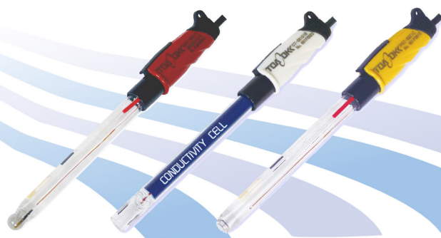
新型電極 GST-58 シリーズ

卓上型水質計の新モデルXシリーズの発表に合わせ、電極もニューモデルに一新されました。測定項目により電極の色が異なりますので、識別が簡単です。また、リード線も従来より柔らかい材質を使用し、取り回しが楽になりました。従来タイプのRシリーズやGシリーズにもそのままご使用いただけます。次のご発注の際に、是非ご用命いただきますようお願いいたします。